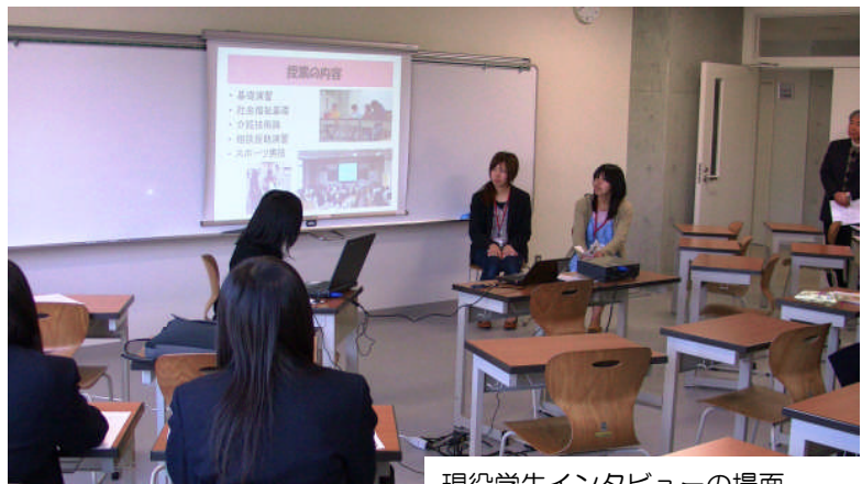
現役学生インタビューの場面

3月27日の土曜日、2010年度の入試に向けたオープンキャンパスが開催されました。実際の入試にはまだ半年以上も前となるこの時期にもかかわらず、保護者も含めて20人近くの方が参加してくれました。定番の学科紹介から始まり、現役学生のインタビューによる学生生活の紹介、海外研修旅行のスライドショーなど盛りだくさんの内容でした。